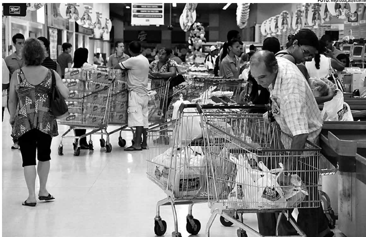
Famílias têm renda reduzida em função dos índices de inflação mais elevados, aumento de impostos e taxas de juros maiores

No caso das pessoas jurídicas, as três linhas de crédito pesquisadas sofreram elevação. A taxa de juros mé-