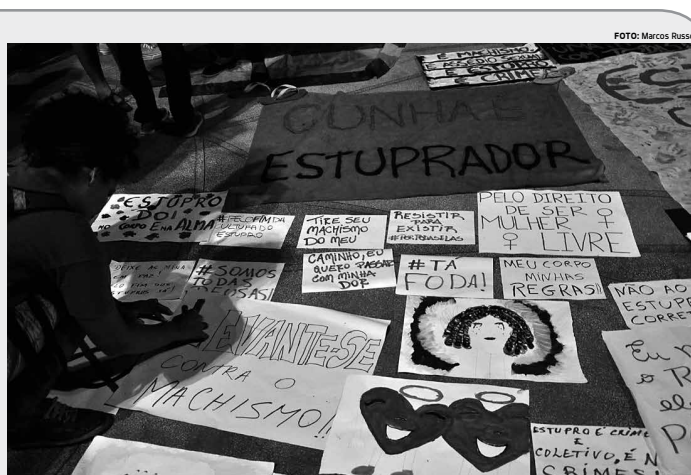
Ato realizado no último dia 2 reuniu centenas de manifestantes na Oria de João Pessoa em protesto contra a cultura do estupro

Também foram arquivados os processos 04253/04, 07839/05, 12232/15 e 03316/06, envolvendo a Companhia de Águas e Esgoto do Estado, a Superintendência de Obras do Plano de Desenvolvimento do Estado, a Prefeitura Municipal de Campina Grande e o Projeto Cooperar.