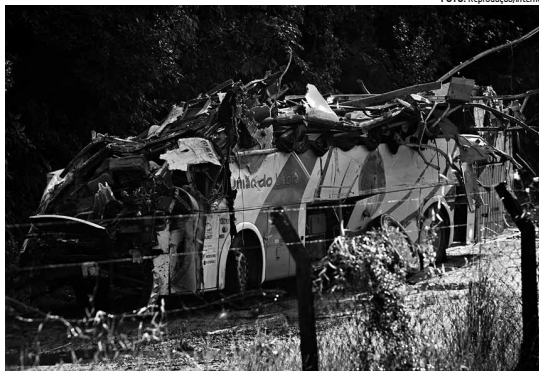
O ônibus foi arrastado violentamente ao tombar, tendo a parte do teto destruída, inclusive a cabine

Pelo menos outras dez pessoas ficaram feridas, duas em estado grave. Uma delas,