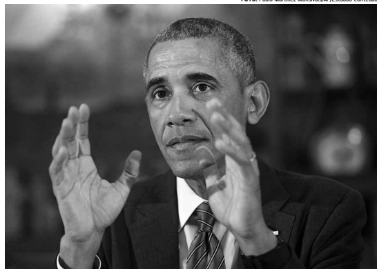
Obama afirmou pelo Twitter que não vê ninguém tão qualificado para o cargo ao se referir a Hillary