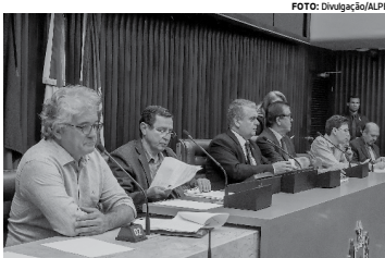
Audiência pública foi proposta pela Frente em Defesa da Cultura