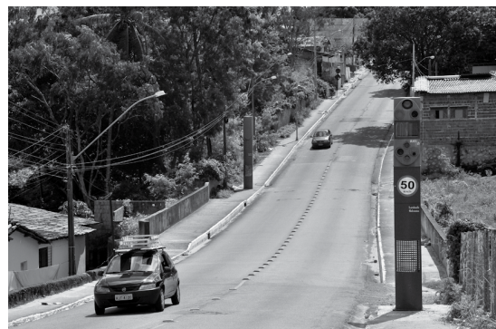
Redutores operam em caráter educativo e passam a funcionar em definitivo dentro de 30 dias

O redutor eletrônico (lombada eletrônica) calcula, através de sensores, a velocidade dos veículos. Caso o limite seja excedido ao máximo permitido, há o